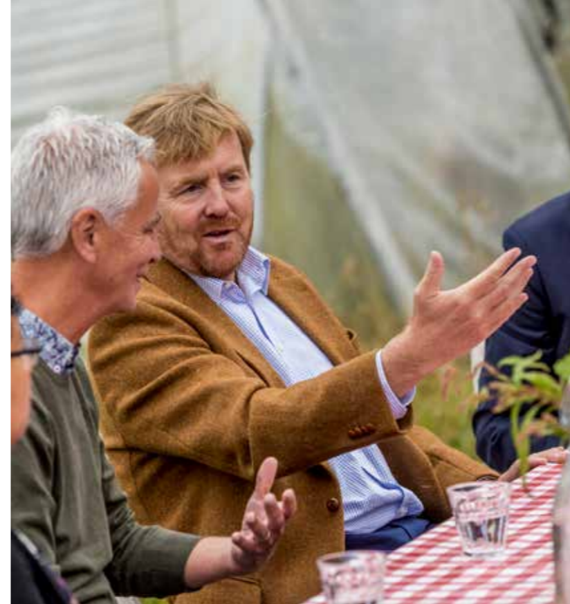
Bezoek van de Koning aan Herenboeren Wilhelminapark, Boxtel, 2019