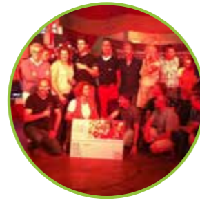
De eerste 24 deelnemers van Herenboeren Wilhelminapark, Boxtel, 2015

Een decennium Herenboeren, dat is het resultaat van ongelofelijk veel mensen die waanzinnig hard hebben gewerkt, te veel om hier op te noemen. Het begon allemaal met de droom van één man.