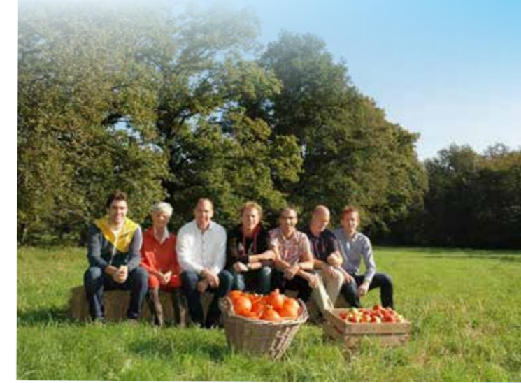
Een aantal vroege pioniers van Herenboeren Wilhelminapark, Boxtel, 2014

“ Iedereen deelt mee in de winsten en verliezen, maar mag ook de spelregels mede bepalen